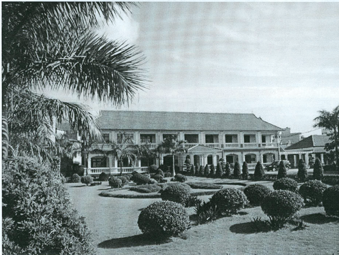
Cảnh quan Xanh - Sạch - Đẹp ở Công ty CP Viglacera Hạ Long