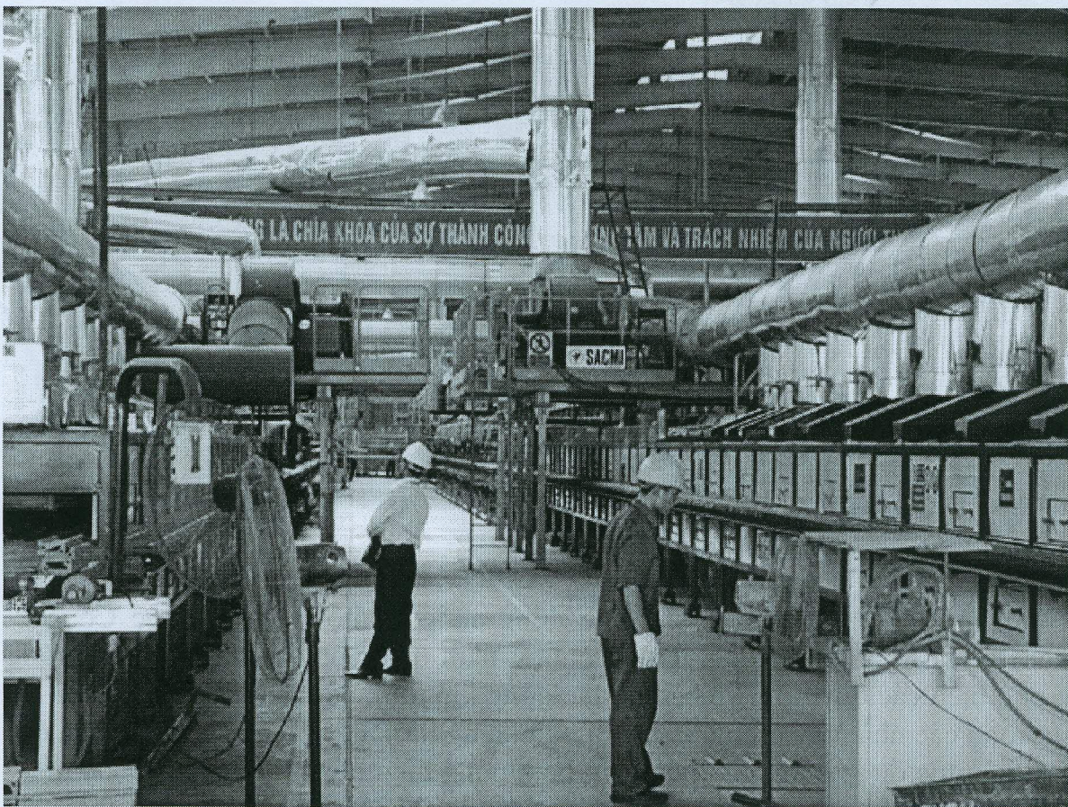
Phong trào thi đua Thực hành tiết kiệm, chống lãng phí được thể hiện ngay từ mỗi công đoạn sản xuất

Là đơn vị đầu tiên trong làng sản xuất đất sét nung Việt Nam áp dụng hệ thống quản lý chất lượng theo tiêu chuẩn ISO 9001:2000, nhiều năm qua, Công ty cổ phần Viglacera luôn quan tâm những giải pháp tạo ra môi trường làm việc trong